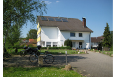
Bürogebäude in Burgebrach

Zum Schluss bleibt mir nur zu sagen: Sollten Sie einmal in der Nähe von Bamberg sein, freue ich mich Sie in der neuen Geschäftsstelle begrüßen zu dürfen. Bitte melden Sie sich vorher an, dann sollte einem Treffen nichts im Wege stehen.