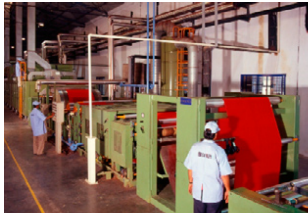
Beflockungsanlage bei Chiripal Industries Ltd.